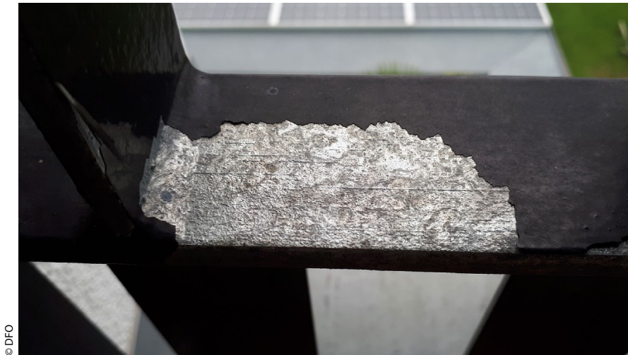
Bild 3 > Feuerverzinktes Substrat mit abgeplatzter Beschichtung: Die Beschichtung des Balkongeländers hat sich rückstandsfrei vom Untergrund gelöst.