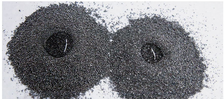
Bild 1 > Um zu prüfen, ob das Strahlmittel frei von Fetten und Ölen ist, kann man in eine aufgehäufte Strahlmittelprobe eine kleine Kuhle eindrücken und Wasser hineingeben. Läuft das Wasser ab, so ist dies ein Hinweis auf eine ausreichende Sauberkeit des Strahlmittels.

Ob das Strahlmittel frei von Fetten und Ölen ist, kann man in den meisten Fällen mit einem einfachen Versuch prüfen. Dazu wird eine Strahlmittelprobe aufgehäuft. Dann wird eine kleine Kuhle eingedrückt und diese mit Wasser aufgefüllt (Bild 1). Sofern das Wasser nicht abläuft, kann man davon ausgehen, dass die Benetzung des Strahlmittels durch Fette oder Öle behindert wird. Läuft das Wasser ab, so ist dies ein Hinweis auf eine ausreichende Sauberkeit des Strahlmittels. Wenn das Wasser das Strahlmittel gut benetzen kann, ist das allerdings nicht immer der Beweis einer ausreichenden Freiheit von benetzungstörenden Substanzen. Handelt es sich bei den Ölen zum Beispiel um wasserlösliche Kühlschmiermittel, so findet eine Benetzung statt, obwohl Öle vorhanden sind. Solche Kontaminationen lassen sich beispielsweise durch eine Extraktion mit