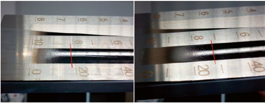
Bild 2 > Ergebnis des Grindometer-Aufzugs einer fehlerfreien Lackcharge (links) und der fehlerhaften Charge (rechts).

war pyrogenes Siliziumdioxid als Mattierungsmittel in der Lackrezeptur enthalten. Als relativ grobkörniger Lackbestandteil verteilt sich das Siliziumdioxid homogen in der Beschichtung, was in einer Aufrauung der Beschichtungstopografie resultiert. Dies ist gleichbedeutend mit einer Reduzierung des Glanzgrades. Über Menge und Teilchengröße der pyrogenen Kieselsäure lässt sich der Glanzgrad einer Beschichtung steuern.