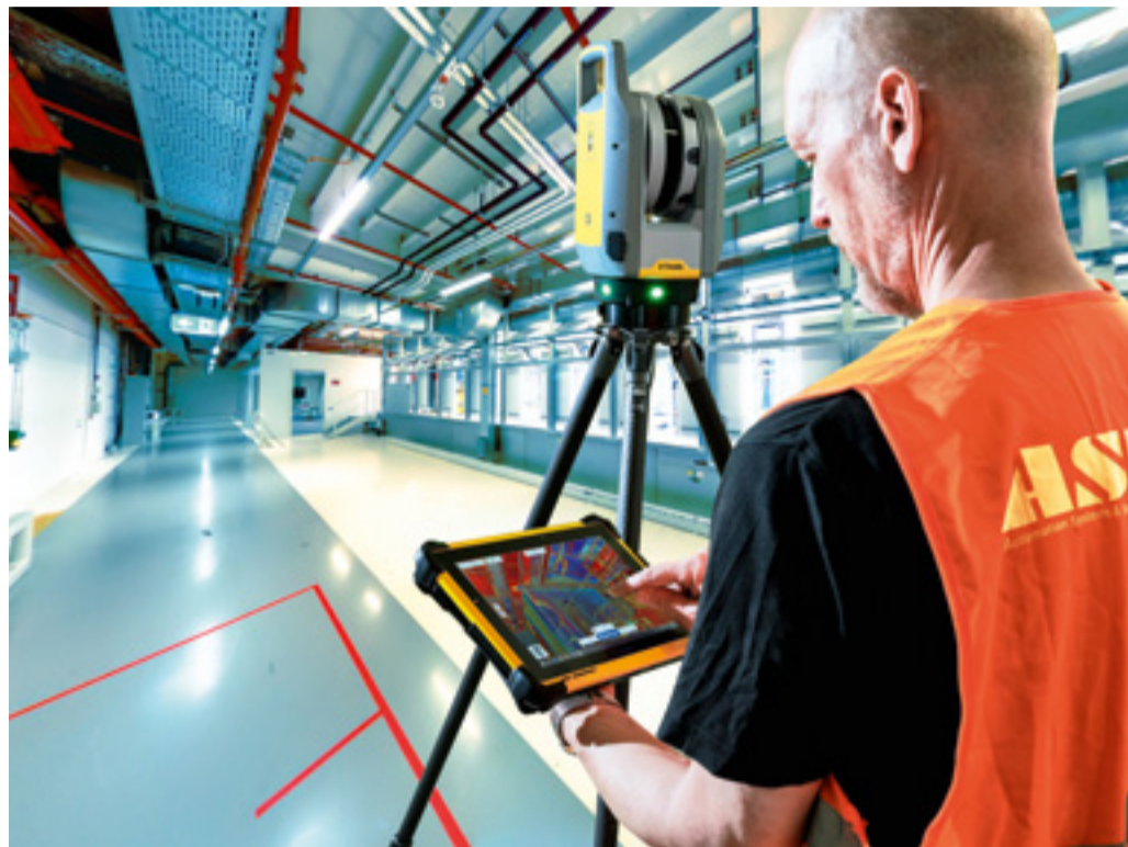
Vor der Anlagenplanung scannt ein Lasersystem die Gegebenheiten extrem genau ein.

Anschließend konvertiert eine leistungsfähige Software die Punktwolke in Flächen und Volumenkörper. Das dreidimensionale Objekt kann nun in gängigen 3D-Program-